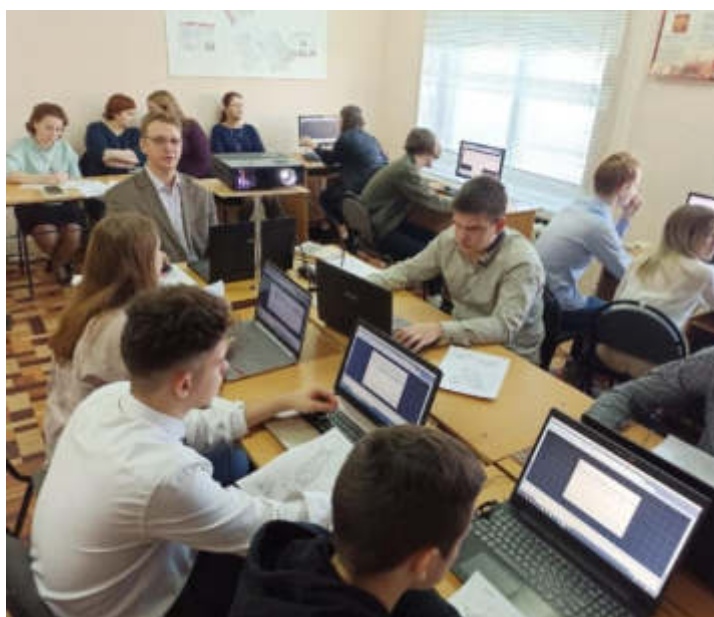
Открытый урок по дисциплине «Инженерная графика»