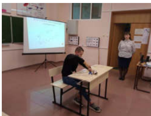
Открытый урок по дисциплине «Электротехника и электроника»