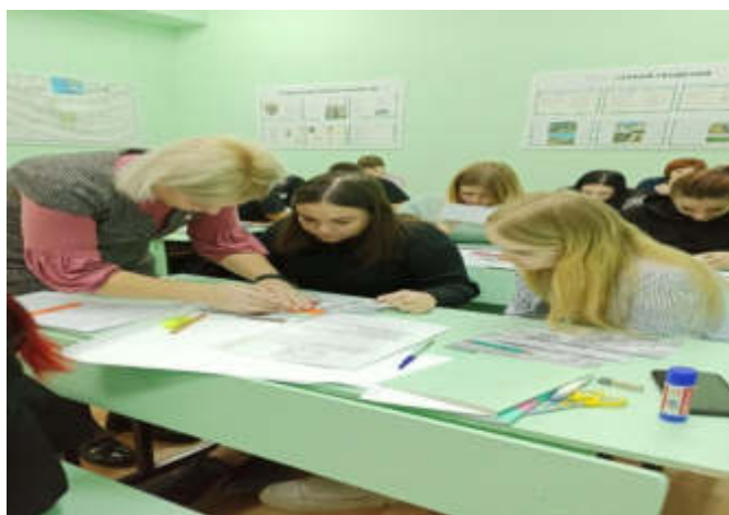
Открытый урок по МДК.01.03 Фотограмметрические работы.

Проведение открытых мероприятий способствует повышению профессионального мастерства педагогических работников в процессе активного