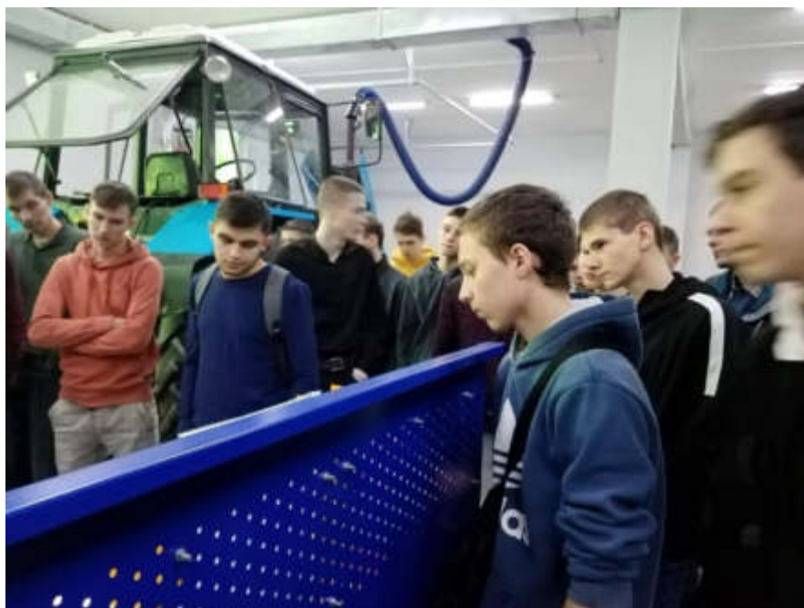
Учебная практика по специальности 35.02.16 Эксплуатация и ремонт сельскохозяйственной техники и оборудования