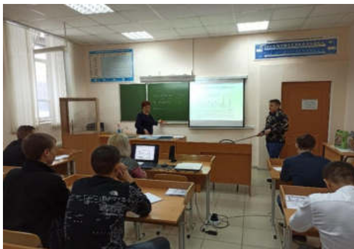
Открытый урок по дисциплине «Материаловедение»